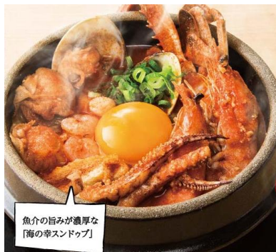
海の幸スンドゥブ