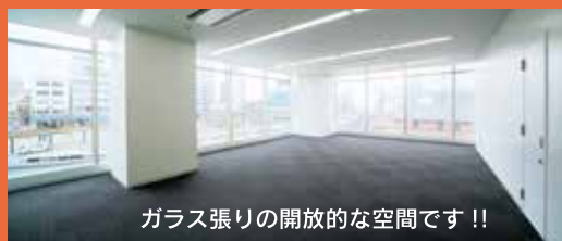
ガラス張りの開放的な空間です!!